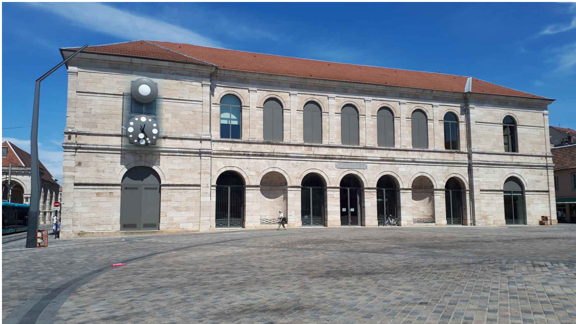
Musée des Beaux Arts, place de la Révolution https://goo.gl/maps/gHiPGQAARyLitgcS9